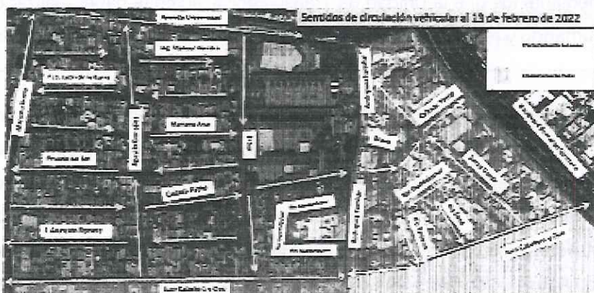
Figura 3. Sentidos de circulación vehicular de los fraccionamientos San Javier y Pathé al 31 de diciembre de 2021.