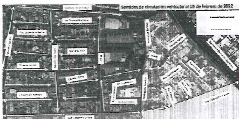
Figura 4. Sentidos de circulación vehicular de los fraccionamientos San Javier y Pathé al 15 de febrero de 2022.